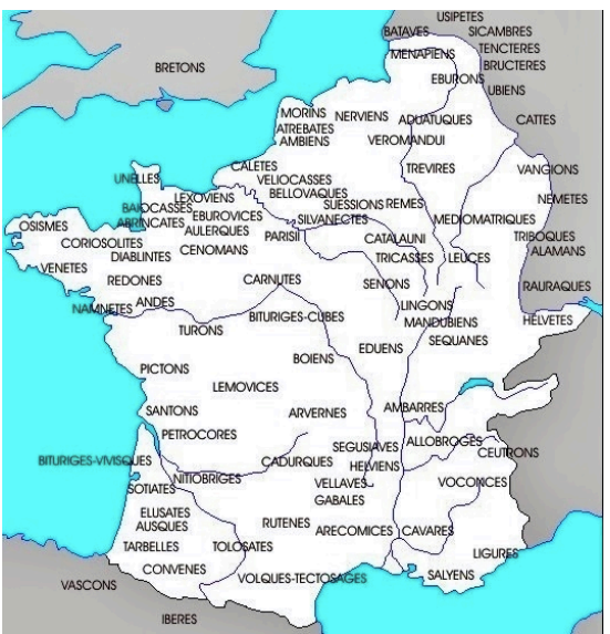
Les tribus celtiques en Gaule

Vers - 800 ans, des tribus celtiques quittent la région des Alpes pour chercher de meilleures terres et envahissent l'ouest de l'Europe. Les Celtés ont déjà appris à travailler le fer, ce qui leur donne un avantage considérable car ils peuvent fabriquer des armes plus résistantes.