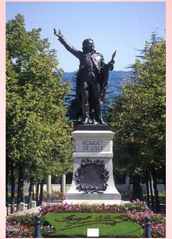
Statue représentant Rouget de Lisle Lons-le-Saunier

Selon toi, la scène représentée sur le tableau est -elle réellement arrivée ? Il y a de fortes chances que le peintre n'ait pas assisté à cette scène et l'ait imaginée.