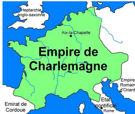
Aix-la-Chapelle dans l'empire de Charlemagne, vers 800.