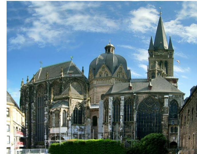
La cathédrale aujourd'hui.

Charlemagne fit bâtir son palais à Aix-la-Chapelle. La chapelle palatine est la partie la plus ancienne de la cathédrale; elle date d'environ 790-800 et fut construite dans le style carolingien. La chapelle faisait partie d'un immense palais où Charlemagne installa sa cour et le trésor. Le palais comprenait aussi des bureaux où travaillaient les scribes, une riche bibliothèque, des ateliers où l'on recopiait les manuscrits et une école qui préparait les fonctionnaires de l'Empire.