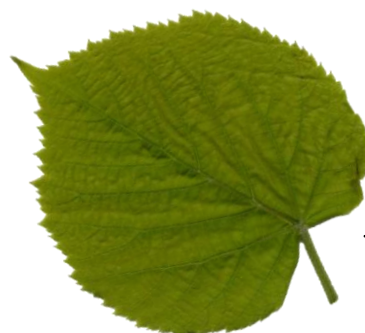
feuille du tilleul

Olga traversa la forêt jusqu'au grand tilleul.