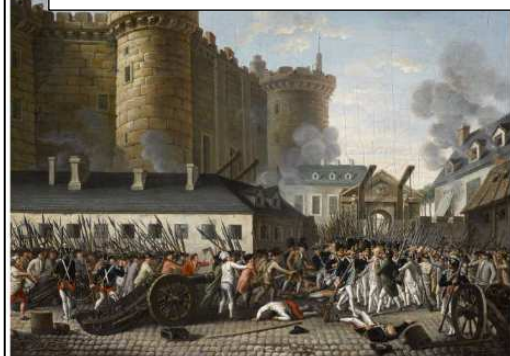
Prise de la Bastille (14 juillet 1789) - Peinture anonyme