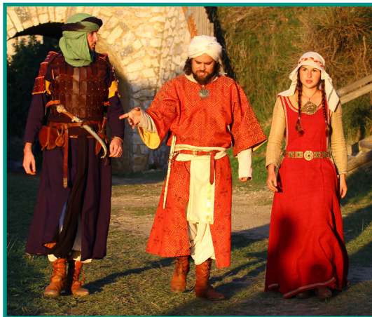
Armutan, l'art de raconter et de mettre en scène

1 er prix «décoration/installation» Pontoise 2010 et «costume historique» Pontoise 2008.