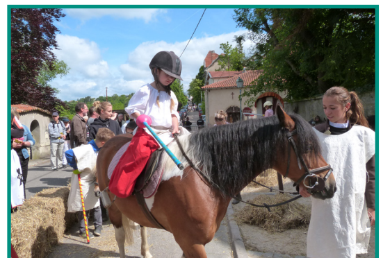
La ferme du Pâtureau

A l'entrée de la fête, dès trois ans, les enfants pourront faire un petit tour en poney et participer à un mini-tournoi équestre !