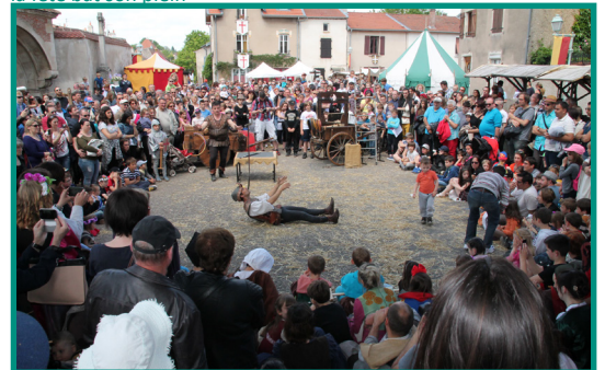
la fête bat son plein

Dans les rues recouvertes de pailles, le marché médiéval regroupe une trentaine d'artisans et de commerçants qui partagent avec le public leur goût pour un savoir-faire ou pour l'histoire.