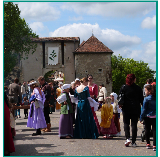
L'entrée du site : la porte-haute

La vieille ville de Liverdun constitue un site idéal à la mise en scène. Juchée sur son éperon rocheux, la cité médiévale domine les environs et offre plusieurs points de vue admirables sur la Boucle de la Moselle. Pour cette reconstitution historique, des lieux sont ouverts au public comme la Chapelle du Bel Amour, la Tour Carrée, l'Eglise St-Pierre, la superbe cave voûtée de l'ancien presbytère transformée pour l'occasion en salle de banquet... La manifestation se déroule devant les portes des Liverdunois qui se prêtent au jeu bien volontiers en décorant leur maison, en prêtant leur cave, en se costumant ou en intégrant l'équipe de bénévoles.