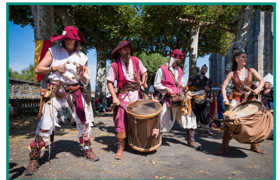
Des musiciens et des personnages hauts en couleur

1 er prix «gros coup de cœur» du marché Fou d'histoire. À l'époque, troubadours et ménestrels égayaient les places de villages ou les tavernes chaleureuses et bruyantes. Sans crier gare, les Compagnons du Gras Jambon chamboulent à leur manière l'univers de la musique médiévale et y insufflent une fougue, un humour et une ardeur toute personnelle. Rythmes puissants et exaltés, mélodies festives et délurées, c'est avec enthousiasme et générosité que ce groupe Toulousain qui «déménage» embrase les foules et partage sa musique débordante de vitalité !