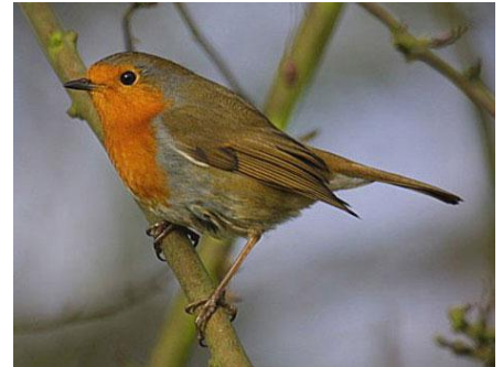
Le rouge gorge