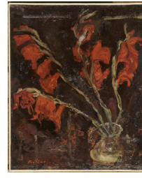
Chaïm Soutine / Glaïeuls / huile sur toile / .56 x 46 cm / vers 1919.