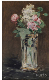
Edouard Manet / Fleurs dans un Vase en cristal / huile sur toile / 54,5 x 35 cm / 1882.