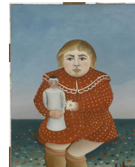
Henri Rousseau / L'enfant à la poupée / huile sur toile / 67 x 52 cm / 1892.