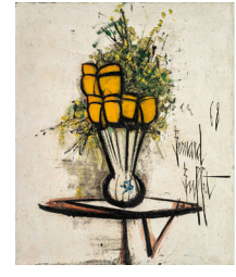
Bernard Buffet / Fleurs Jaunes dans un Vase / huile sur toile / 65 x 50 cm / 1968.