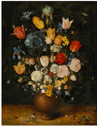
Jan Brueghel l'Ancien / Nature morte aux fleurs dans un vase en grès / huile sur chêne / 67 x 51 cm / 1610.