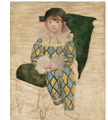
Pablo Picasso / Paul en Arlequin / huile sur toile / 130 x 97 cm / 1924.