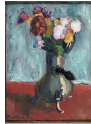
Henri Matisse / Bouquet de fleurs dans la chocolatière / huile sur toile / 64 x 46 cm / 1902.