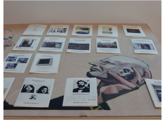
1/ Chapelle Saint-Loup / Huile sur bois / 2019. 2 / Vue de l'atelier. 3 / tableau transformé en table / huile sur bois / posés dessus différents manifestes.