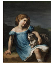
Théodore Géricault / Louise Vernet, enfant / huile sur toile / 127 x 101.6 cm / 1818.