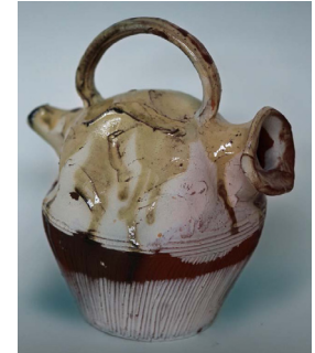
1 / Extrait du film Ballet Barbare 4 : une procession / 2017. 2 et 3 / Pots, Fleurs et autres Cruches (détails) 2009/2012, ensemble de 27 peintures à l'huile et de 19 céramiques, dimensions variables.

Ballet Barbare 4 : une procession est l'enregistrement d'une tentative de réconciliation, bancale et tardive. Les habitants d'un village viennent rendre un dernier hommage à un peintre oublié, retiré du monde, entouré de ses petites peintures de pots de fleurs aux couleurs fanées. Ce film s'inspire librement des obsèques de Malévitch en 1935 organisées par l'artiste comme ultime oeuvre d'art, une procession en livre une version rurale, bucolique et burlesque, pleine de réminiscences de mon enfance auvergnate et de la présence pacifique des animaux.