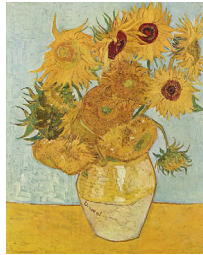
Vincent Van Gogh / Tournesols (Nature morte) : Vase avec douze tournesols / huile sur toile / 91 x 72 cm / 1888.