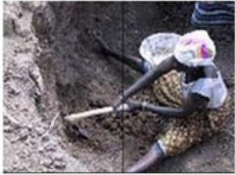
Extraction de l'argile d'une carrière

1. À cet endroit le sol a été creusé ; que vient-on chercher dans cette carrière ?