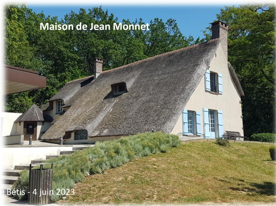
Petite balade digestive au jardin de Jean Monnet