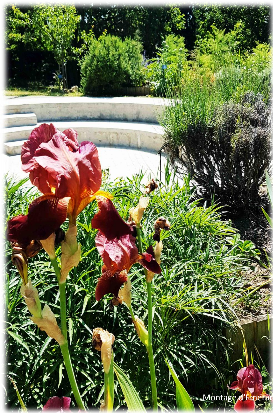
Montage d'Émerance Bétis - 4 juin 2023