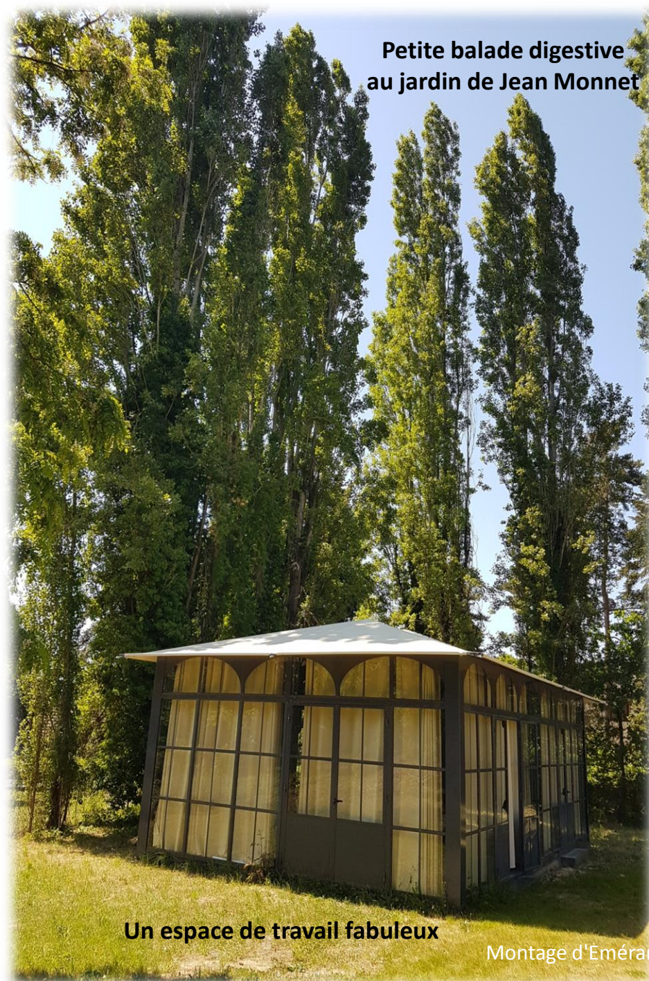
Un espace de travail fabuleux