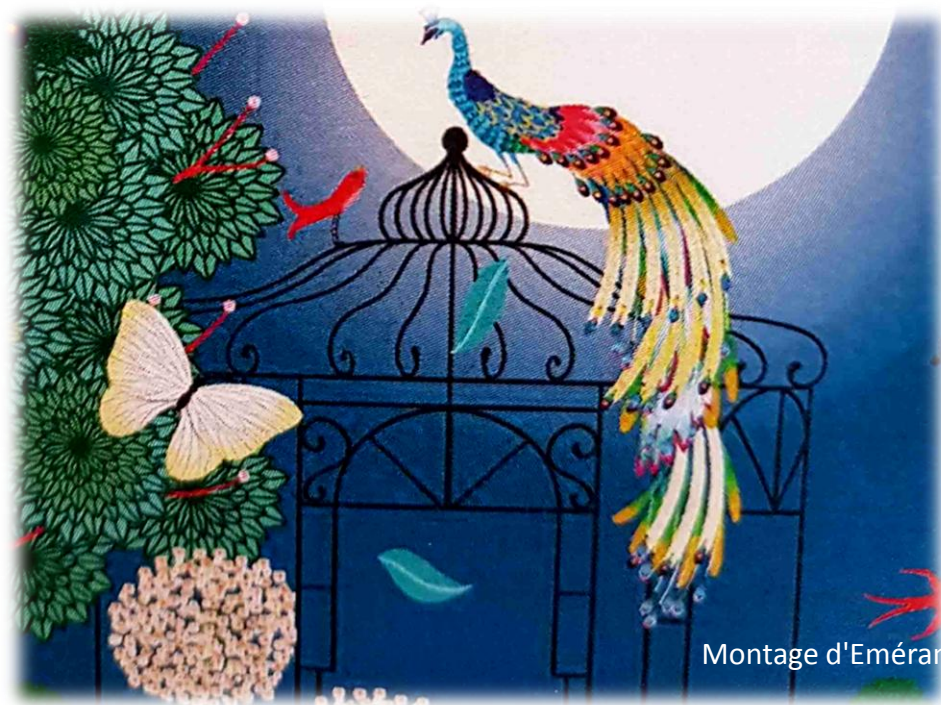
Montage d'Eméranthe Bétis - 4 juin 2023