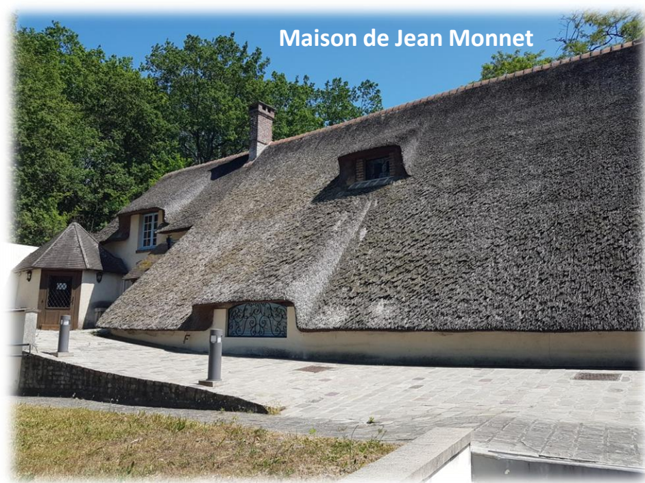
Maison de Jean Monnet