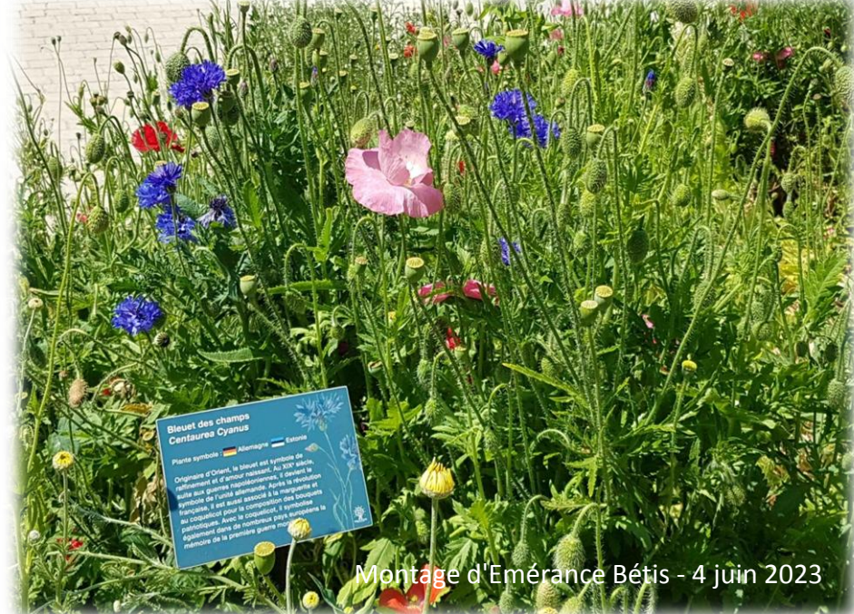
Montage d'Emérance Bétis - 4 juin 2023