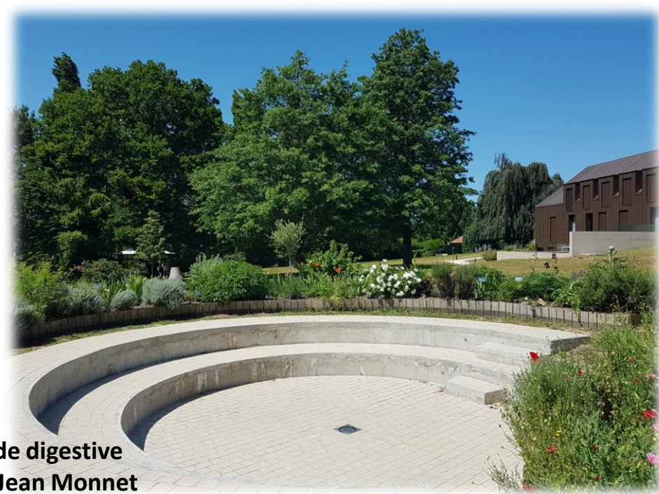
Petite balade digestive au jardin de Jean Monnet