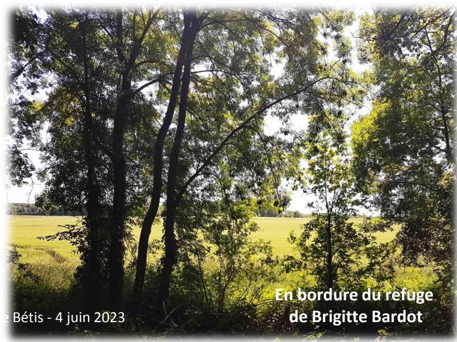
En bordure du refuge de Brigitte Bardot