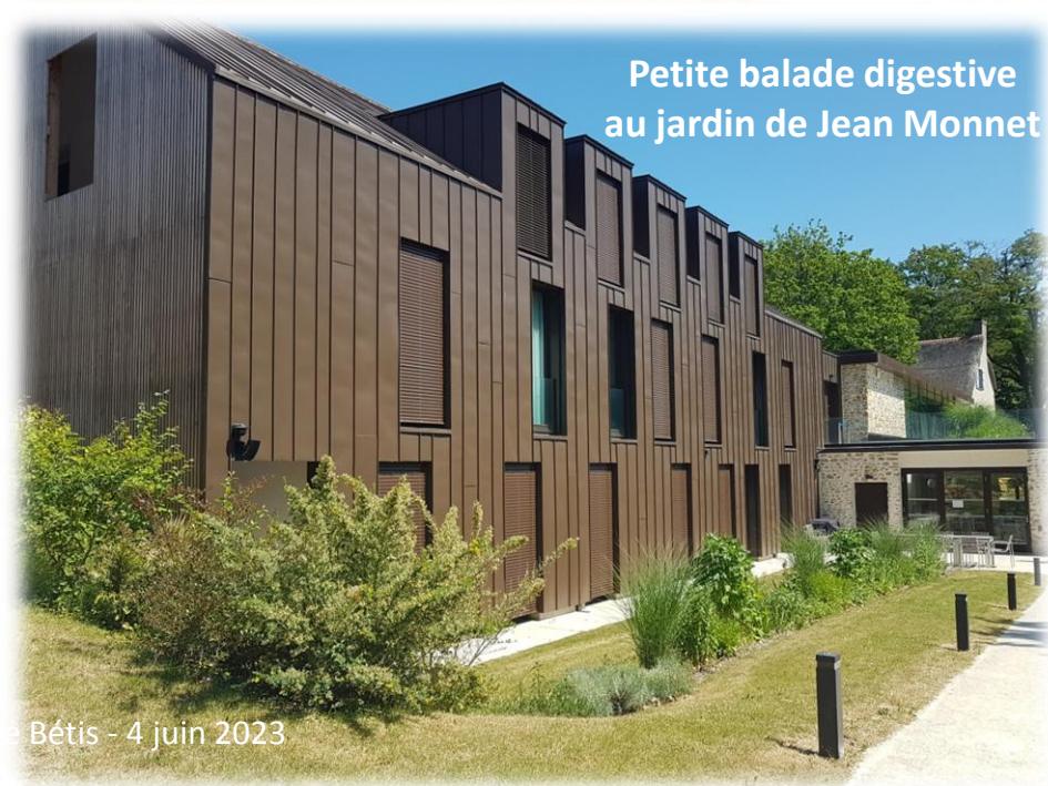
Petite balade digestive au jardin de Jean Monnet