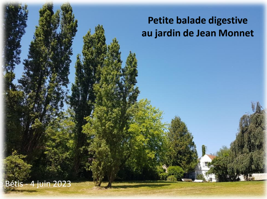
Petite balade digestive au jardin de Jean Monnet