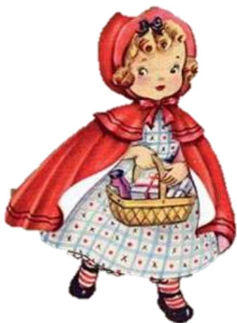
le petit Chap eron Rouge