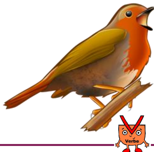
L' oiseau chante .