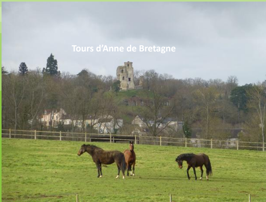
Tours d'Anne de Bretagne