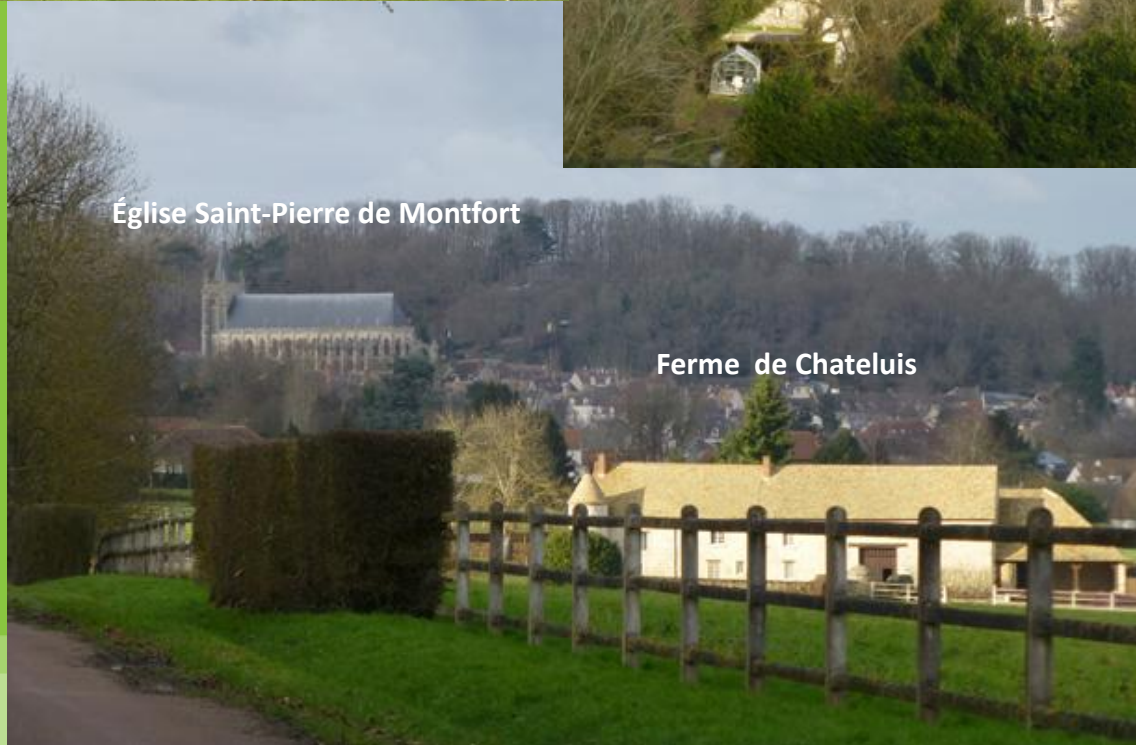
Ferme de Chateluis