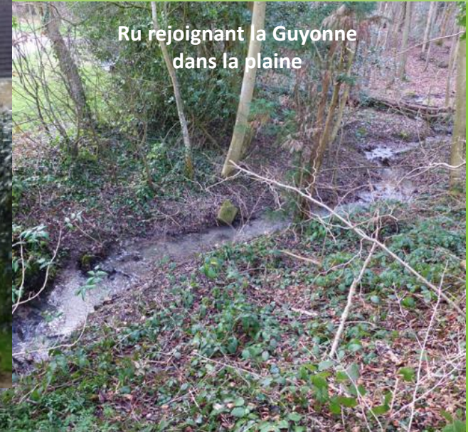
Ru rejoignant la Guyonne dans la plaine