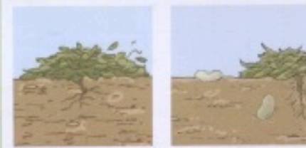
DOC. 4 Un plant de haricot après la fructification

4 Deux événements peuvent se produire après l'apparition des graines. Lesquels ? Aide-toi du DOC. 4 pour répondre.