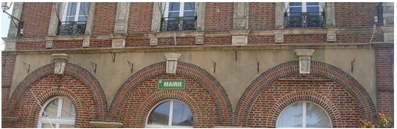
la façade apres nettoyage

Je n'avais pas eu à l'époque l'idée de prendre des photos, mais je me rends sur le site Google Street View qui permet de naviguer virtuellement dans les rues; par bonheur, la rue principale longe la mairie. L'image n'est pas très nette, mais elle permet malgré tout de voir qu'il y avait bien des nids d'hirondelles (surtout sur la façade de droite), qui ont donc été détruits depuis.