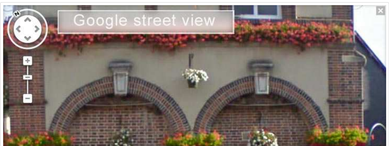
la façade avant le nettoyage

Je n'avais pas eu à l'époque l'idée de prendre des photos, mais je me rends sur le site Google Street View qui permet de naviguer virtuellement dans les rues; par bonheur, la rue principale longe la mairie. L'image n'est pas très nette, mais elle permet malgré tout de voir qu'il y avait bien des nids d'hirondelles (surtout sur la façade de droite), qui ont donc été détruits depuis.