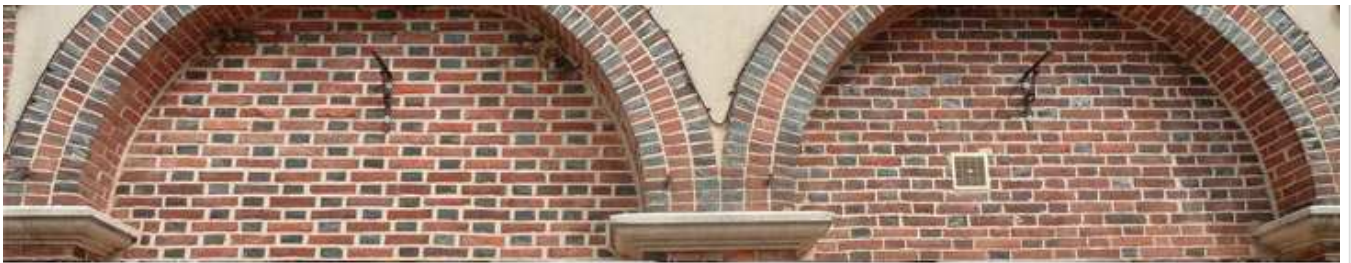
la façade apres nettoyage

Alors la question se pose : se peut-il que les responsables communaux aient confondu des nids de pigeons avec des nids d'hirondelles ?