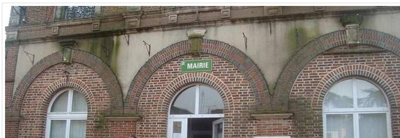
la façade avant le nettoyage

Or, en voyant les photos présentes sur le site, montrant la mairie "après le nettoyage", je n'en vois plus aucun.