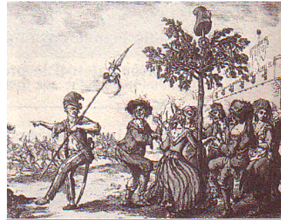
1°/ Danse de la carmagnole devant un arbre de la liberté (1789).

Robespierre Maximilien de (1758-1794) Député d'Artois en 1789. Membre de la Convention. Devient un des chefs des Montagnards et demande la condamnation de Louis XVI. Instaure, en 1794, la politique de la Terreur . Fait guillotiner certains de ses adversaires. Arrêté le 27 juillet 1794, il est guillotiné le lendemain.