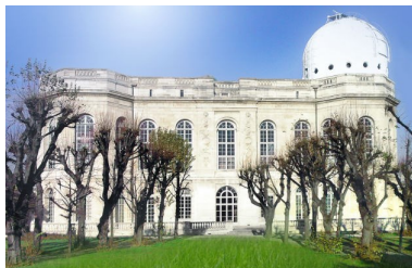
L'observatoire de Paris