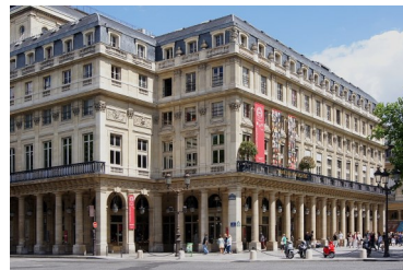
La Comédie Française