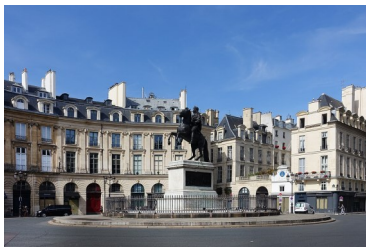
La place des Victoires