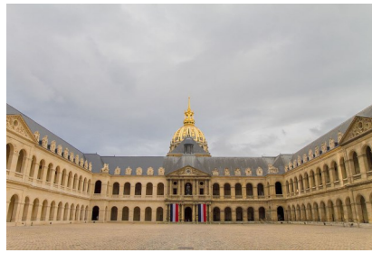
L'hôtel des Invalides