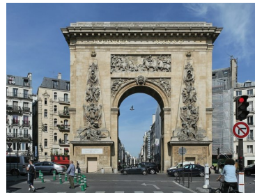
La porte Saint-Denis