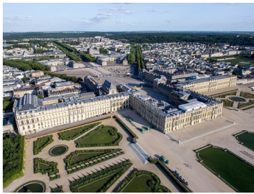
Le château de Versailles