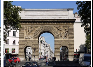
La porte Saint-Martin