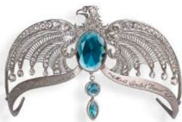
Diadème de Rowena