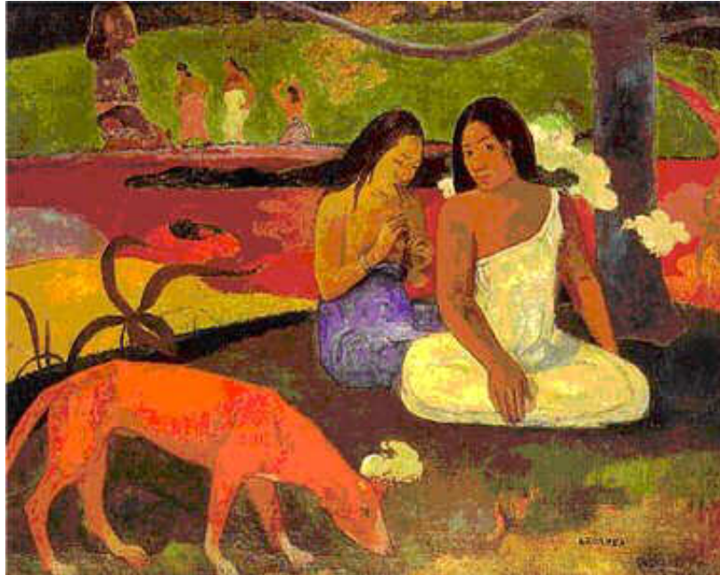
Arearea ou le Chien rouge - 1892