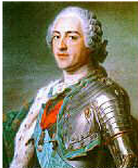
Louis XV per La Tour

Maurice-Quentin de La Tour (XVIII ème siècle)