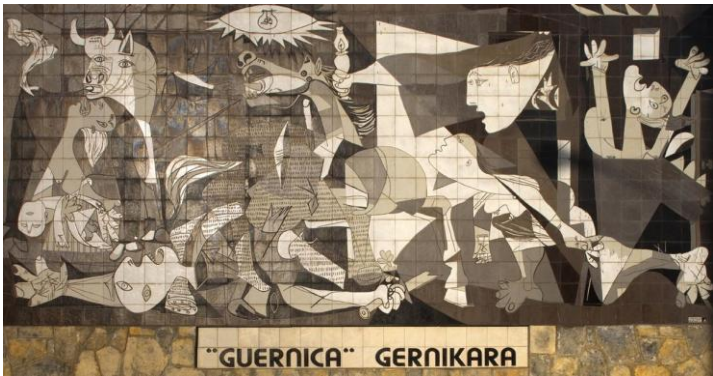
Une grande œuvre de Picasso « Guernica » 349cm x777 cm 1937