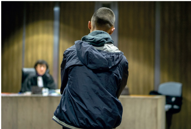
Moi et la justice pénale, parcours mineur