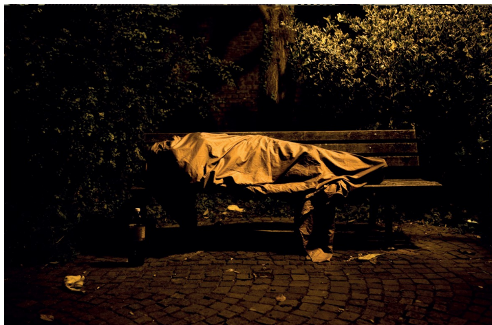
A la rue