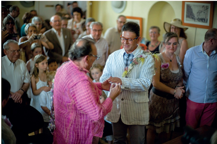
Un mariage gay