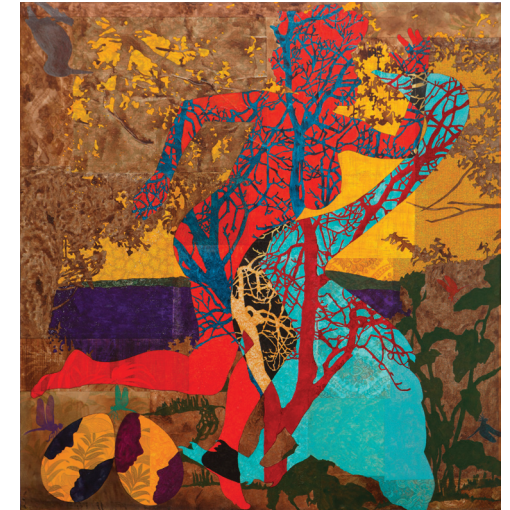
Mythos 5, Leda et le cygne, encre et crayon sur papier et bois.