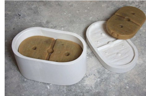
Flotteurs / 2014/ cire d'abeille / plâtre