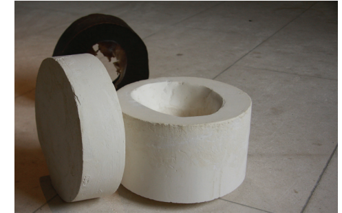
Matrice/ 2014/ cire d'abeille / plâtre

Véronique Lamare prélève la justesse d'un geste, le souffle de l'effort, l'enveloppe des objets, le cadre où s'inscrit ses actions. Elle touche avec délicatesse les états du monde.