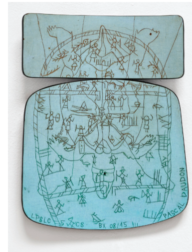
Les pieds sur la chaise 05, Gravure au stylet sur formica avec incrustation de pastel gras dans les sillons.