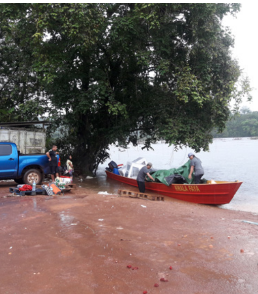
La pirogue qui va transporter le matériel de Camopi au village de Trois-Sauts