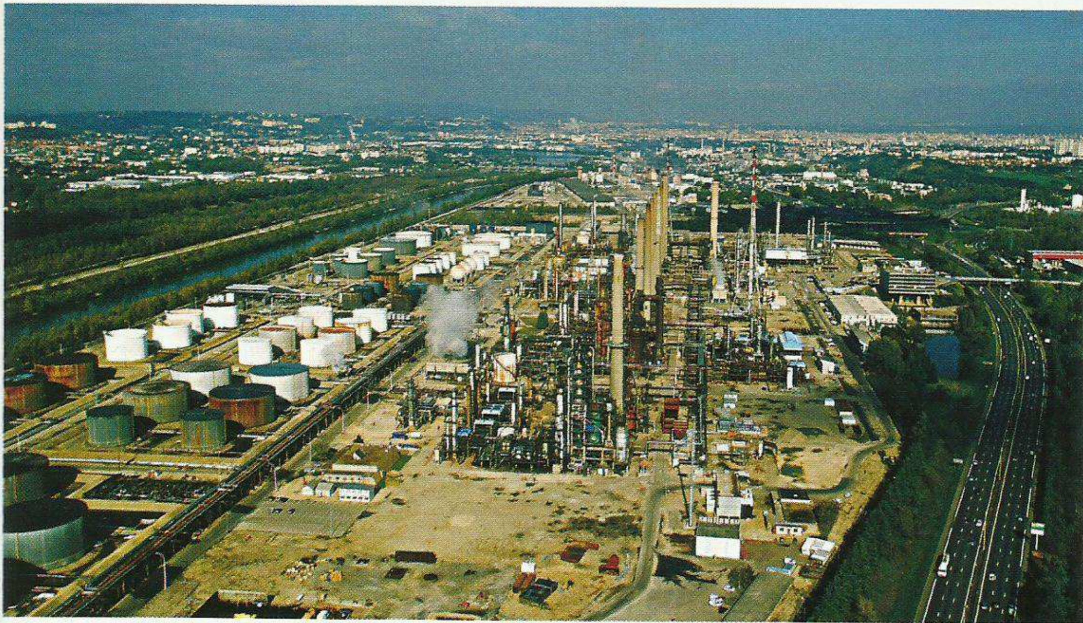
Doc. 2 : Le couloir de la chimie, à Lyon-Feyzin (Rhône).