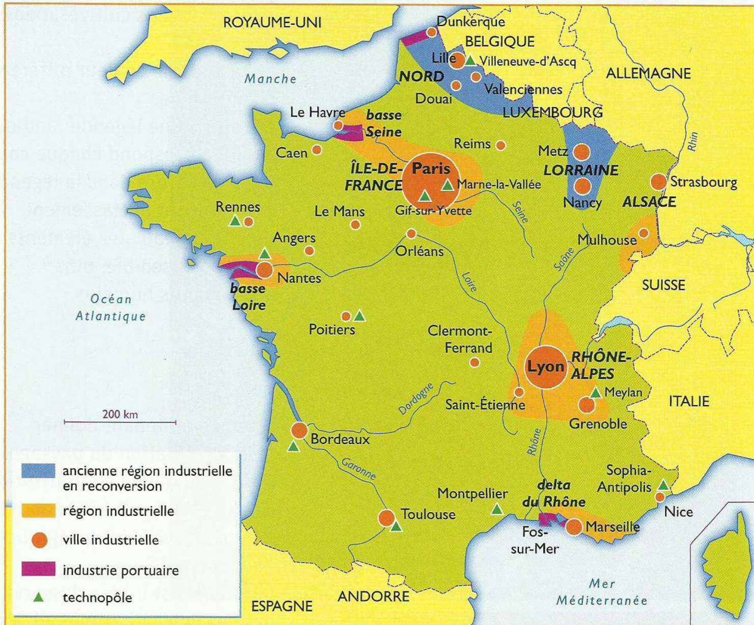
Doc. 1 : L'industrie en France.