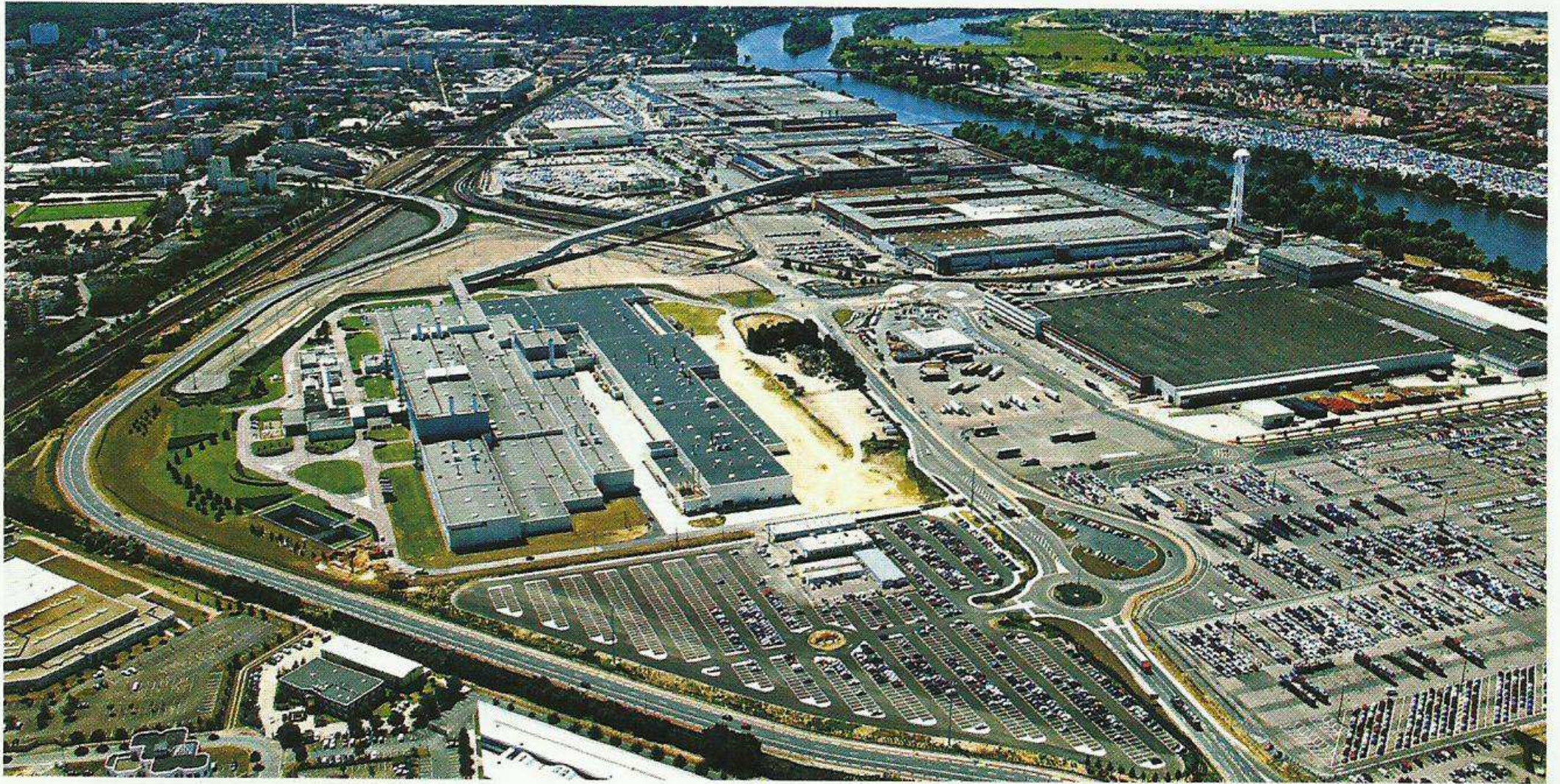
Doc. 3 : L'usine de construction automobile de Peugeot-Citroën, à Poissy (Yvelines).