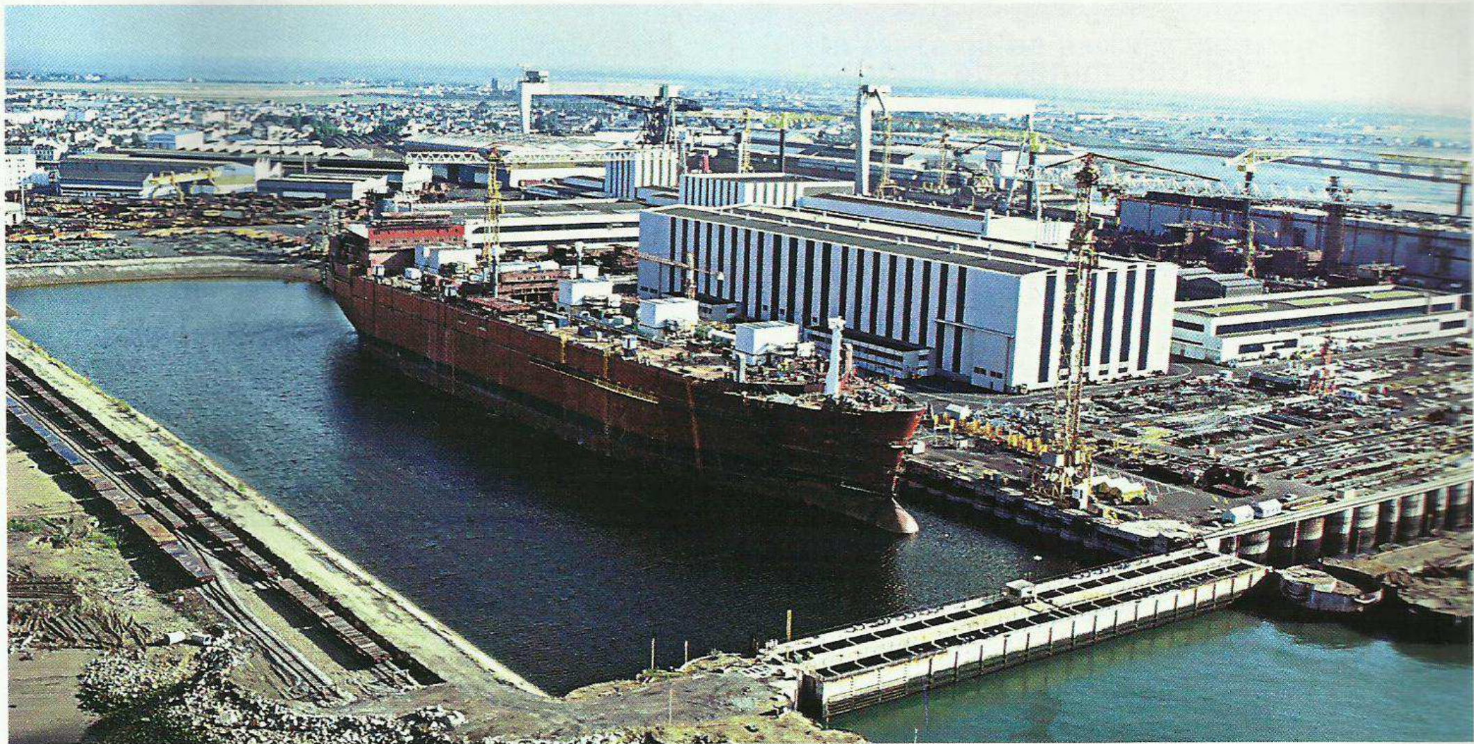
Doc. 4 : Les chantiers navals de Nantes-Saint-Nazaire (Loire-Atlantique).