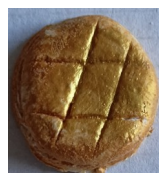
Galette en pâte à sel