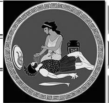
Illustration by Carla DeMello, IRIS Design Team, Cornell University Library