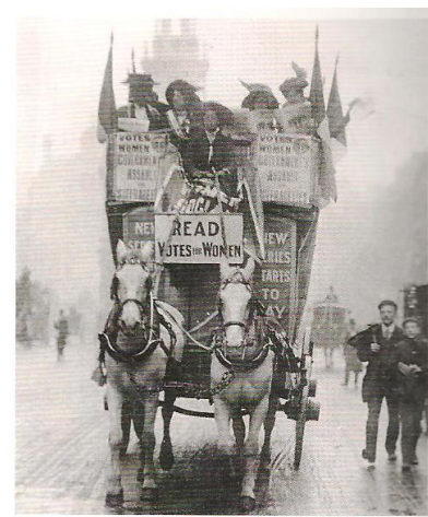
Manifestation de femmes à Londres, en 1905.