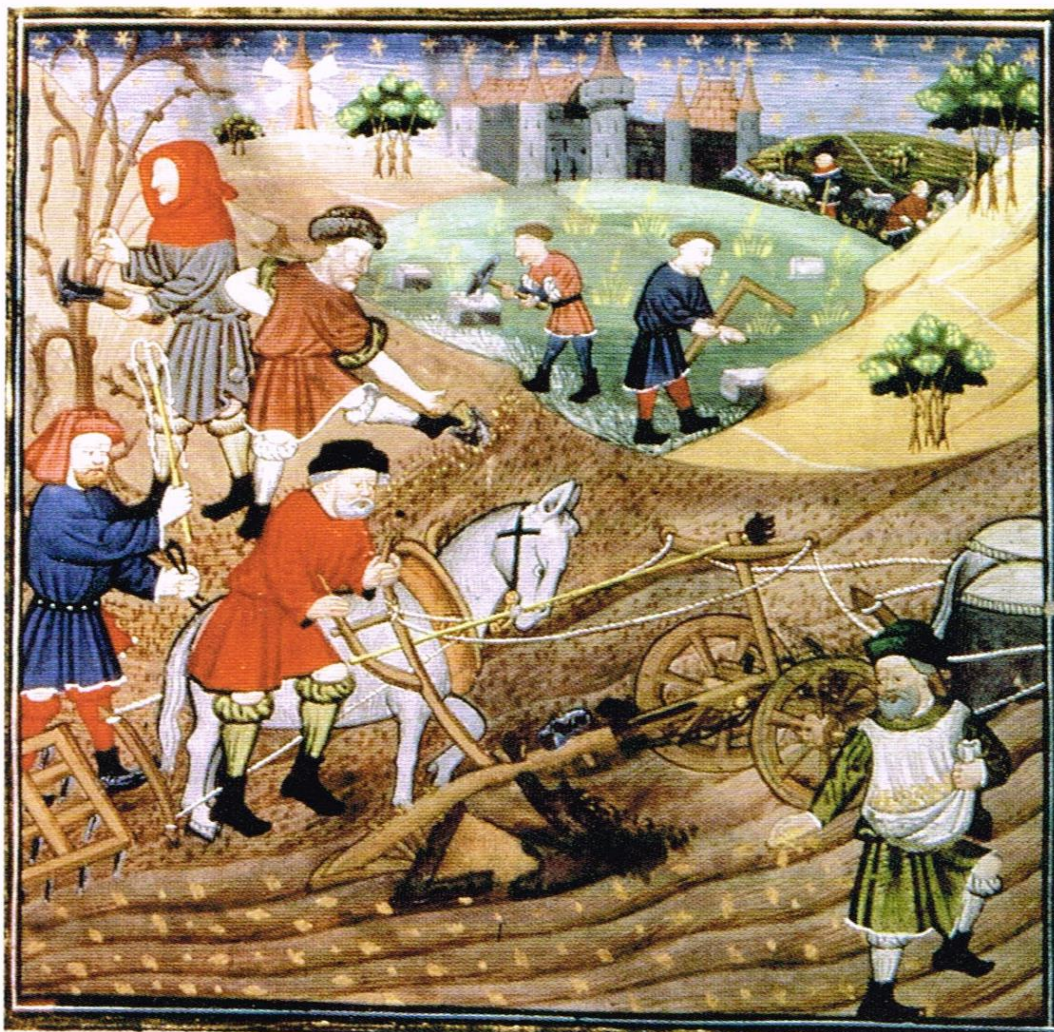
Doc. 5 La seigneurie (miniature du 15 e siècle).