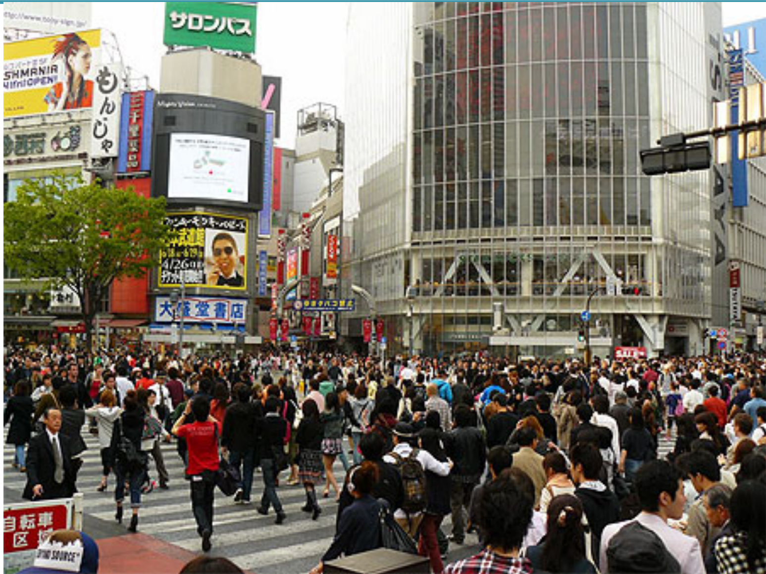
Tokyo, la capitale.