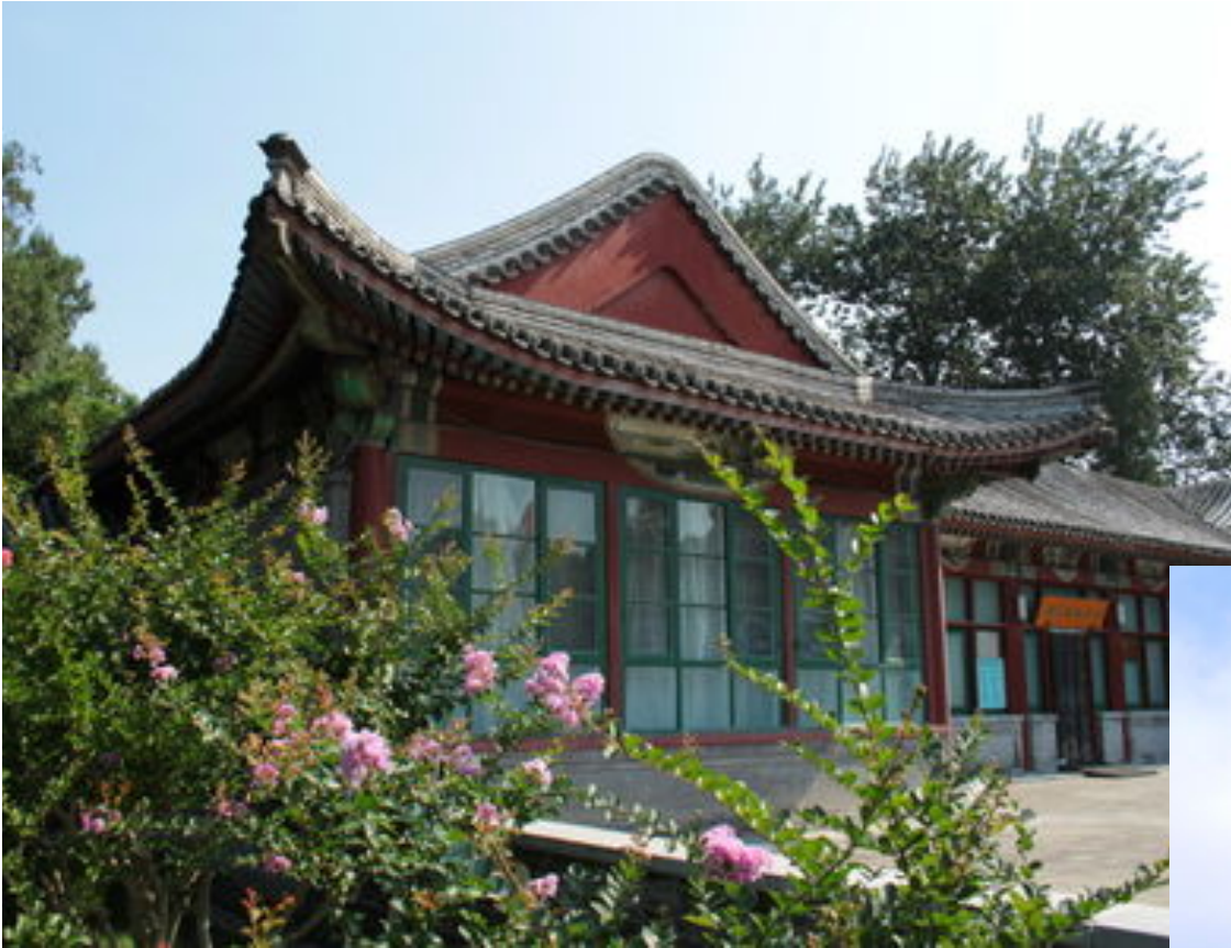
Les maisons traditionnelles chinoises.