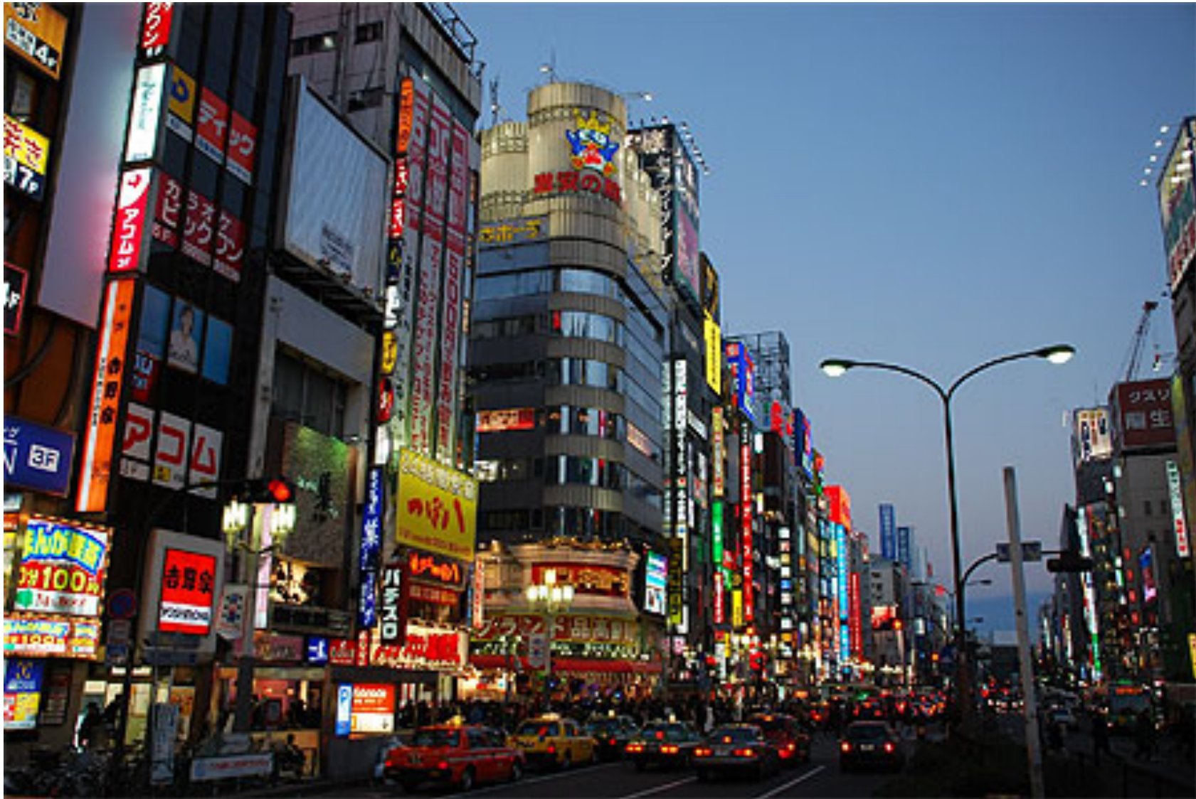
Tokyo, la capitale.