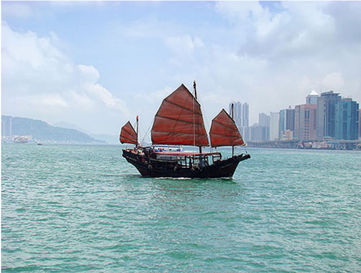
Une jonque à HONG-KONG