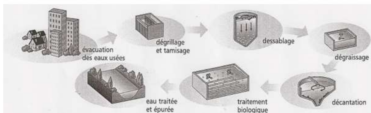
La station d'épuration

Voici le schéma d'une station d'épuration.