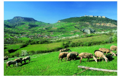
Le Massif central