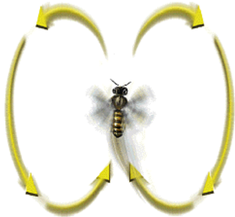
Danse des ouvrières, la "danse frétilante" ou "danse en huit"