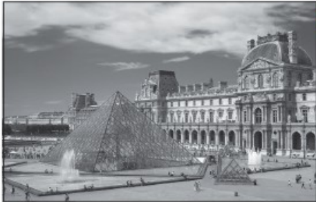
Doc. 5 Musée du Louvre à Paris.