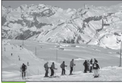
Doc. 3 Ski dans une petite station en Haute-Savoie : Flaine.