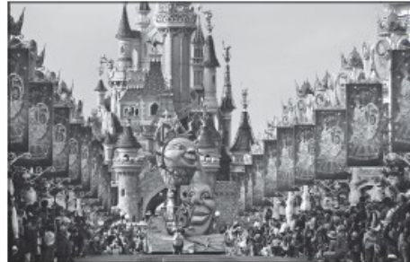
Doc. 6 Parc d'attraction de Disneyland Paris à Mame-la-Vallée.