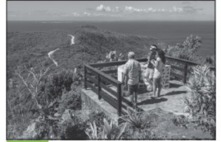
Doc. 4 Randonnée de touristes en Guadeloupe.