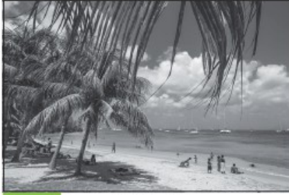
Doc. 2 Plage de la Martinique.