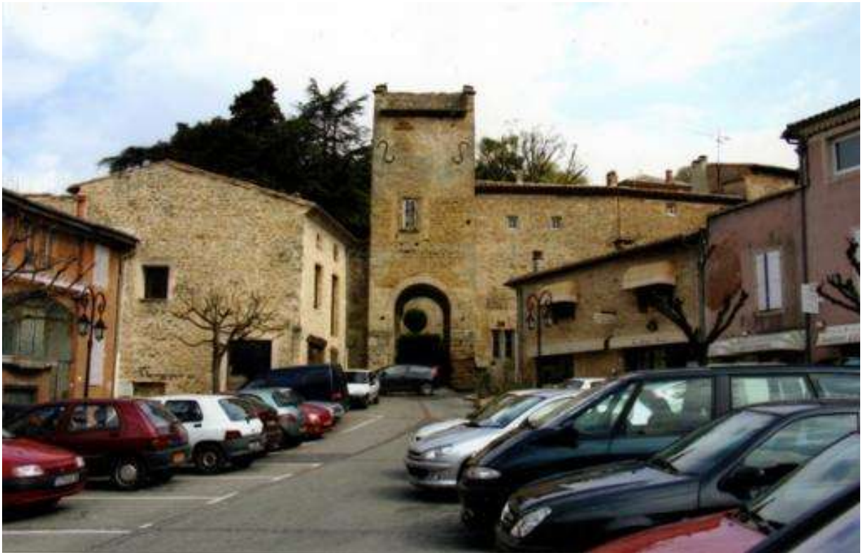
L'hebdo du pédago, avril 2015