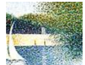
Un dimanche après-midi à l'île de la Grande Jatte, 1884.