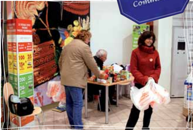
La collecte alimentaire organisée fin novembre au Super U a enregistré des dons de 2,4 tonnes de marchandises.

E n Mars 2008, une nouvelle équipe municipale s'est mise en place à la Mairie de Combrit, et tout naturellement le nouveau CCAS s'est investi dans sa mission. Depuis le printemps une épicerie communale s'est installée. Ouverte tous les jeudis dans les locaux de l'ancien atelier municipal, cette dernière répond aux besoins alimentaires et de première nécessité des personnes en difficulté. La confidentialité y est respectée, et chacun y trouvera une oreille attentive.