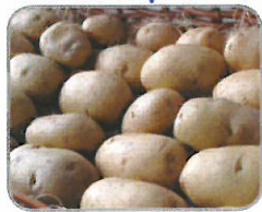
pomme de terre