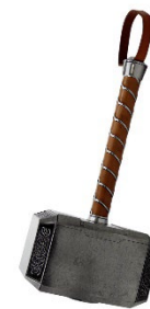
Le marteau de Thor