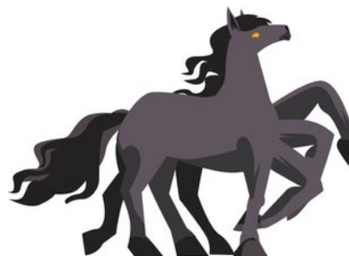
Le cheval d'Odin

4. Pour remercier Magni, que lui offre Thor ?