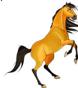
Le cheval du géant