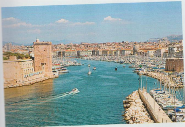
Le Vieux Port de Marseille , une grande ville en bord de mer dans le Sud de la France.

Quelles ressemblances et quelles différences remarques-tu ?