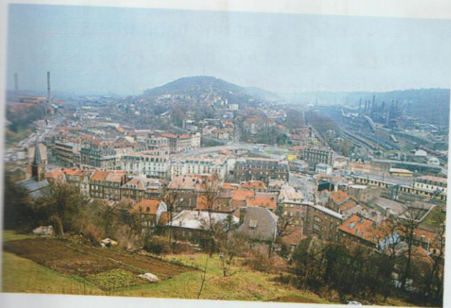
Longwy , une petite ville de Meurthe-et-Moselle.