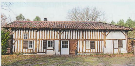
Dans les Landes