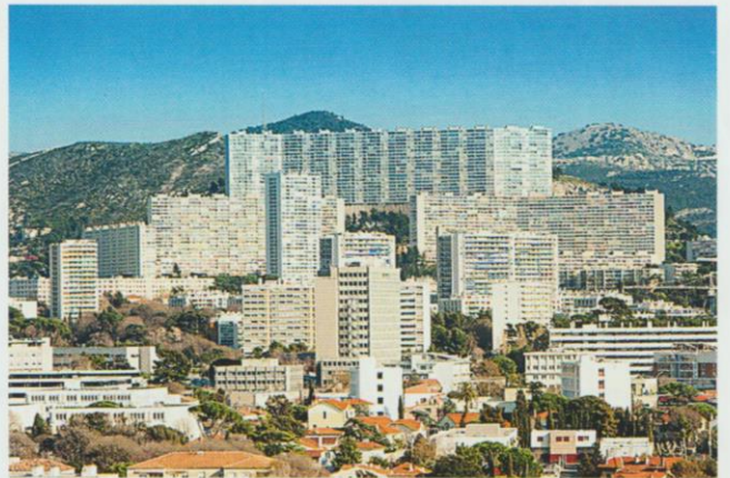
Le quartier de la Rouvière à Marseille .