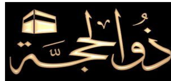
12) DHOUL HIDJA