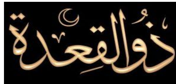
11) DHOUL QA'ADA