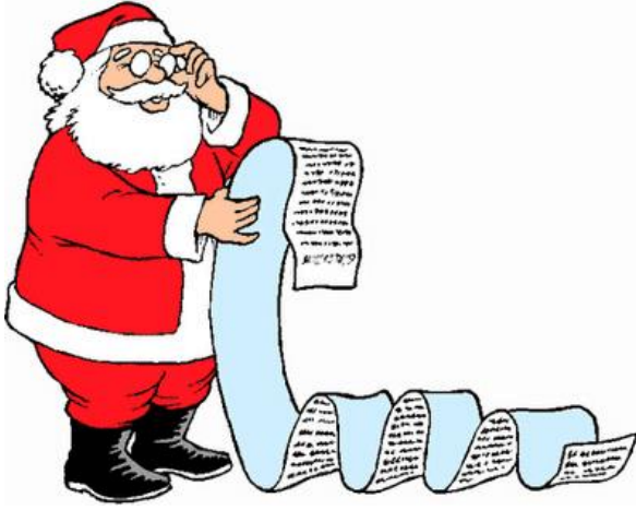
Le Père Noël a une lettre.