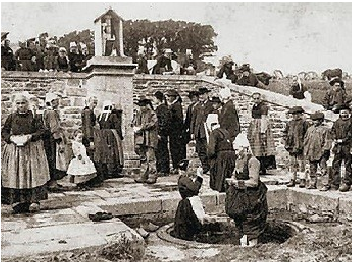
Bain dans une « bonne fontaine » au XIXe siècle