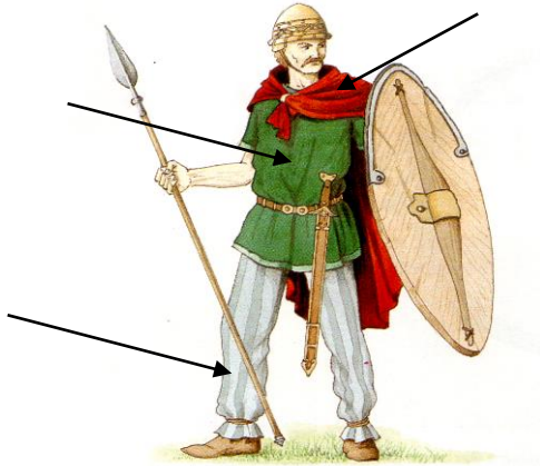
▲ 1. Un guerrier gaulois. III e siècle avant J.-C. Reconstitution.

2. Complète le dessin avec les 3 légendes :