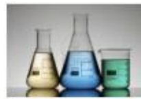
Tableau de conversions Mesures de capacités et de volumes