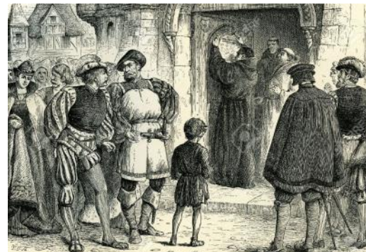
Martin Luther cloue ses 95 thèses sur la porte de la cathédrale - Illustration par Gustav Freytag, publiée par The Open Court Publishing Company, 1897

Le 31 octobre 1517, on retrouve affichées sur les portes de l'église de Wittenberg, en Saxe, un texte dans lequel le moine Martin Luther , professeur de théologie à Wittenberg, dénonce les scandales de l'Église de son temps. Séduits par les 95 thèses en latin que Luther a présentées en plutôt à l'université, certains de ses étudiants ont jugé bon de les traduire en allemand et de les diffuser autour d'eux. Diffusées très vite dans toute la population instruite de Saxe et d'Allemagne grâce à l' imprimerie , leur succès a été immédiat parce qu'elles faisaient écho aux inquiétudes profondes relatives au salut éternel et aux interrogations sur les pratiques douteuses du haut clergé catholique, notamment au Vatican. Parmi les abus que dénonce Luther se trouvent les indulgences , sorte d'aumônes tarifées que le clergé catholique a pris l'habitude de récolter auprès des fidèles contre la promesse d'un allègement de la durée d'attente au Purgatoire... Cet événement qui va ébranler les fondements du catholicisme marque l'origine de ce que l'on appellera bientôt protestantisme et va transformer le paysage religieux de l'Europe pour les siècles à venir.