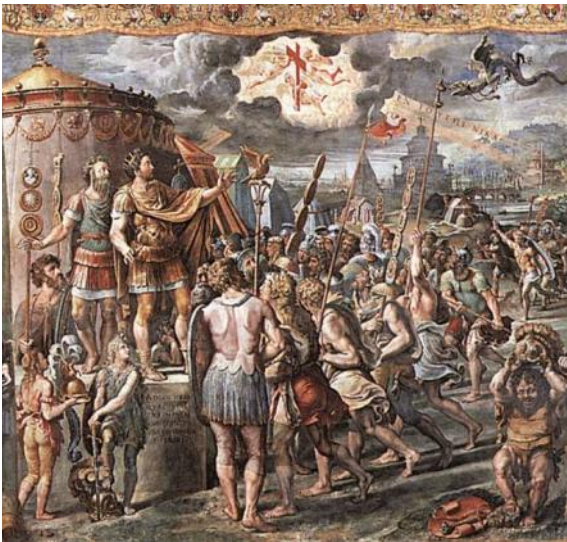
"La vision de la croix" (détail), par l'école de Raphaël (1520-1524), chambres du Vatican à Rome.

L'édit de Milan lève les interdits qui pèsent sur la communauté des chrétiens. Les Églises locales se voient restituer les biens qui leur ont été confisqués. Par la suite, le christianisme gagne de plus en plus la faveur des classes supérieures et des élites intellectuelles et urbaines. À Rome même, Constantin engage la construction des basiliques de Saint-Pierre, du Latran et de Saint-Paul-hors-les-murs . Fort de la protection impériale, le christianisme prend son essor et s'impose en quelques décennies comme la seule religion officielle de l'empire .