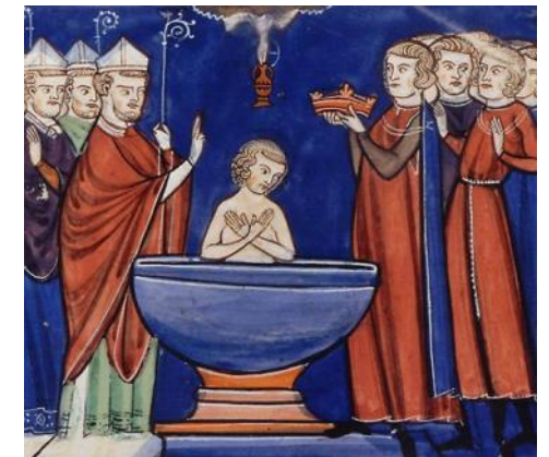
Représentation du baptême de Clovis dans un manuscrit du XIII e ( Vie de saint Denis , BNF)

Cet événement est important pour la monarchie française car les rois sont à partir du IX e siècle sacrés en la cathédrale de Reims et la monarchie franque peut désormais régner avec l'appui de l'Eglise. Clovis crée la monarchie héréditaire de droit divin et fonde la dynastie des Mérovingiens .