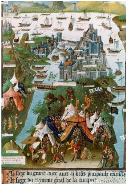
Le siège de Constantinople ; miniature réalisée à Lille en 1455 (manuscrit de Bertrandon de la Broquière, BNF)

Au milieu du XV ème s., pourtant, réduite à environ 40.000 habitants, Constantinople n'est plus qu'un petit État en relation avec les marchés d'Extrême-Orient pour le plus grand bénéfice des marchands de Venise et de Gênes qui s'y approvisionnent en soieries chinoises. Le basileus (empereur en grec) Constantin XI meurt au milieu de ses gardes lors de l'assaut final. Mehmet II fait aussitôt transférer sa capitale d'Andrinople à Constantinople (rebaptisée Istamboul ). La période qui suit bientôt appelée Renaissance devra beaucoup aux savants et artistes byzantins qui, réfugiés en Italie, ont contribué à la redécouverte de la culture antique par les Occidentaux.