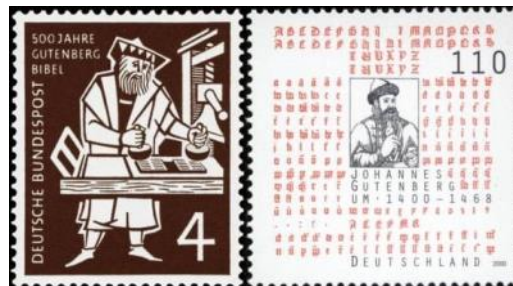
Timbre allemand commémoratif du 500ème anniversaire de l'impression de la bible par Gutenberg

Avec les livres imprimés se répandent l' instruction et, plus encore, l' esprit critique . C'est dans la continuité de cette révolution de l'imprimé que se produira la fracture intellectuelle dans la chrétiété occidentale avec la Réforme de Martin Luther et l'émergence du protestantisme .