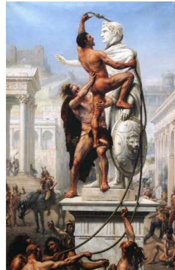
Le sac de Rome par les Barbares en 410 (peintre Joseph Noël Sylvestre 1890)

Le 24 août 410 , la ville de Rome, capitale de l'Empire romain d'Occident, Ville éternelle, est prise par les Wisigoths du roi Alaric Ier . Peuple germanique jadis établi dans l'Empire romain d'Orient en bénéficiant du statut de « fédérés », c'est-à-dire d'alliés militaires, il ravagea au III e siècle les Balkans puis l'Italie. Après l'échec de deux sièges, en 408 et en 409, Alaric, roi des Wisigoths, entreprend le blocus de Rome et parvient à pénétrer dans la ville sans combattre, parce que la reddition de la ville semble avoir été négoциée , les pillages (le terme sac est un synonyme de pillage) sont limités et ne durent que 3 jours mais de nombreux Romains sont tués ou réduits en esclavage. Le retentissement du sac de Rome fut important dans tout le monde romain et chrétien et fut considéré comme un signe annonciateur de la fin des temps.