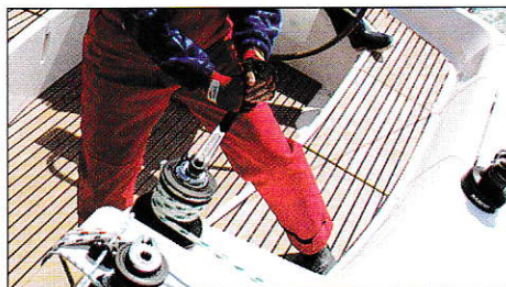
Bien se caler sur ses pieds.

L'équipier qui embraque doit être bien stable. L'idéal est d'être en appui sur ses pieds, calé par les genoux. Pour embraquer, on travaille les bras tendus afin d'avaler le plus de bout possible à chaque mouvement. On alterne alors le mouvement en faisant une rotation des épaules. Pensez à garder un œil sur ce qui se passe à l'autre bout de votre cordage.