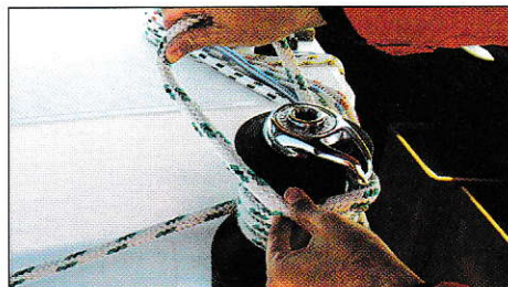
Bloquez le cordage sur le self-tailing.

Le self-tailing est une sorte de gorge sur le dessus du winch dans laquelle on passe le bout en le bloquant. Vous pouvez alors «mouliner» avec les deux mains, sans avoir à tirer sur le cordage.