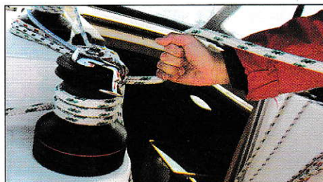
Prenez le bout à pleine main et embraquez.

L'écoute ou la drisse est tendue. Il faut maintenant la bloquer sur le winch afin de ne pas perdre le gain de l'effort. A ce stade, on effectue des tours supplémentaires en maintenant le cordage en tension.