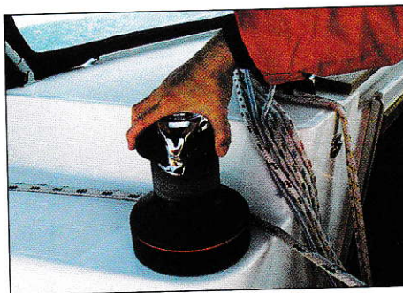
Vérifiez le sens de rotation du winch.

Il est plus aisé de prendre le bout par l'extérieur de la main et de le bloquer sans trop forcer avec les doigts. Avec les bouts de faible diamètre, il est conseillé de porter des gants. L'embraqueur doit faire de grandes brassées pour avaler au plus vite le cordage (surtout si c'est une écoute), et régler ainsi rapidement sa voile.