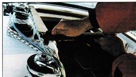
Installez la manivelle.

Assurez-vous que vous la tenez bien en main. Une manivelle passe facilement à l'eau. Certains modèles sont munis de cliquet qui évite qu'elles sortent une fois en place.