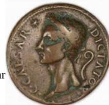
Monnaie de Jules César