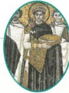
Mosaïque, VI e siècle.