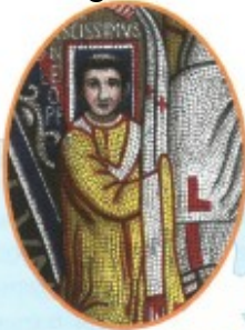
Mosaïque, VIII e siècle.

Alors qu'à la fin du VIII e siècle, l'autorité du pape Léon III est remise en cause au sein même de la communauté catholique, Charlemagne intervient pour l'aider à restaurer son pouvoir. Le pape voit alors en Charlemagne un allié fidèle et puissant.