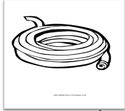
un tuyau un tuyau