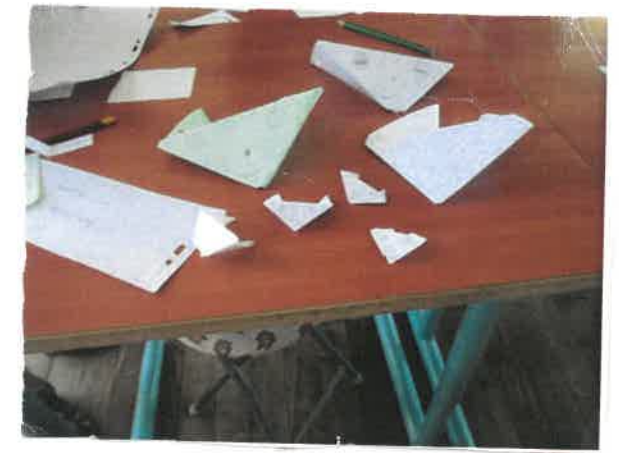
Chien en papier