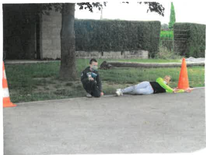
"Les techniques du gardien, tout savoir"

Cette photo décrit, une personne qui a aimé un stand, en coloriant un visage content.