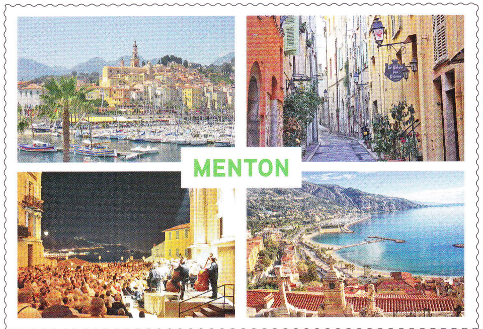
Carte postale de Menton (Alpes-Maritimes).