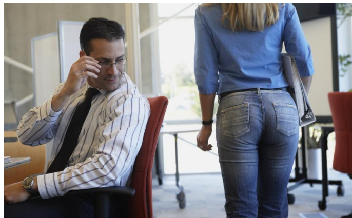
Un employé d'une entreprise française qui regarde sa collègue.